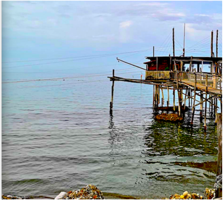
Punta IsolataPunta Cavalluccio.