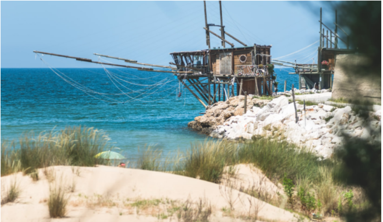
Il Trabocco Trimalcione