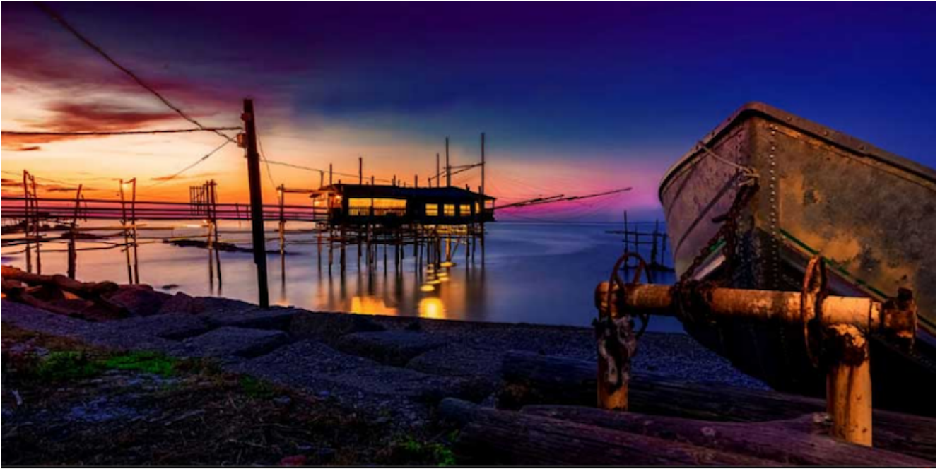
Il trabocco Valle Grotte

Mucchiola , Ripari Bardella Propone una cucina dall'impronta più contemporanea. Pancotto ai frutti di mare, risotto con clorofilla, burrata e frutti di mare. Punta Tufano , Vallevò Sauté di vongole, di cozze, la grande pasta allo scoglio al profumo di mare.