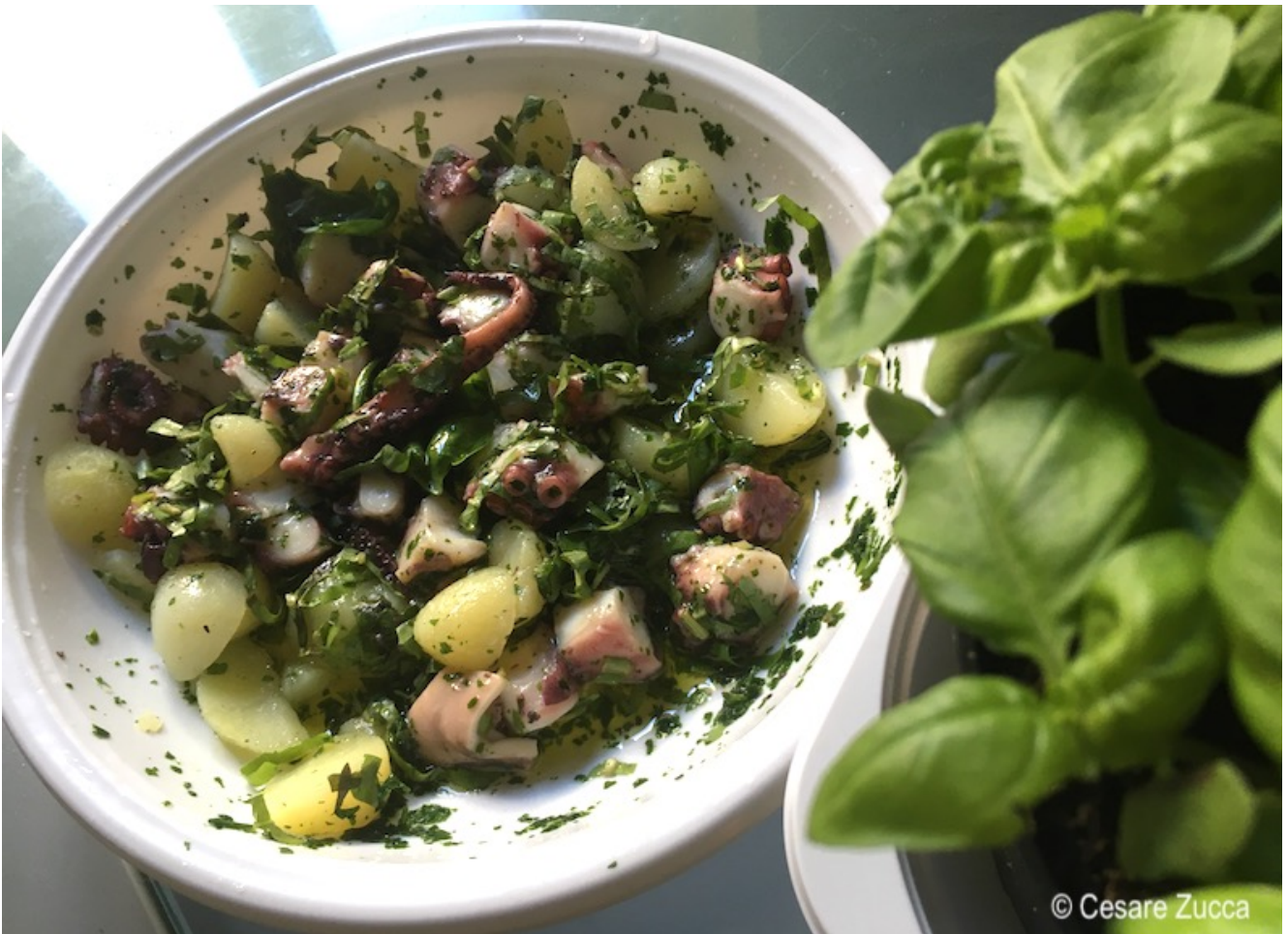
Uno dei miei piatti preferiti: l'insalatina di polpo e patate 17 Lune, Punta PunciosaTrimalcione, Punta Penna