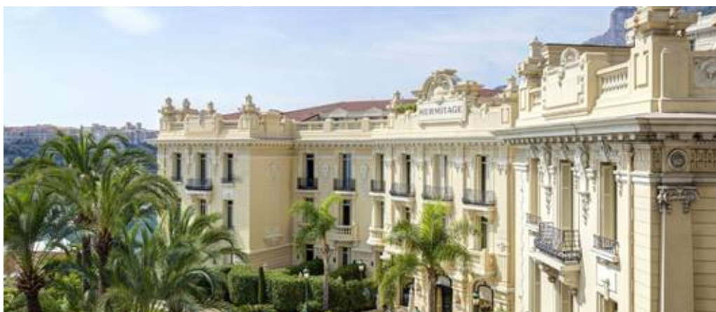
Hôtel Hermitage Monte-Carlo

L' Hôtel Hermitage Monte-Carlo si presta alla perfezione per un weekend di lusso tra innamorati e costituisce un bozzolo elegante per il vostro soggiorno sul mare a Monaco. Nel cuore di Monte-Carlo, a due passi dal porto Hercule, quest'hotel 5 stelle affascina per la sua cornice romantica, tipica della Belle Époque .