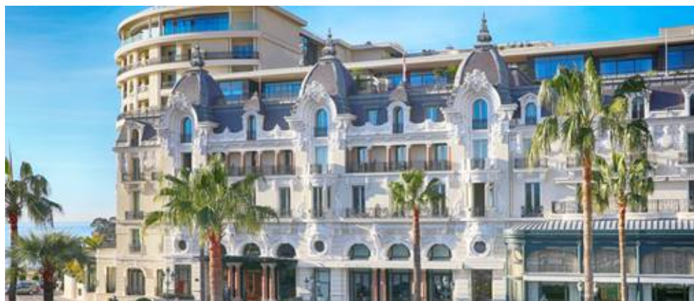
Hôtel de Paris Monte-Carlo

L'Hotel de Paris Monte-Carlo, l'esclusività con vista sul mare