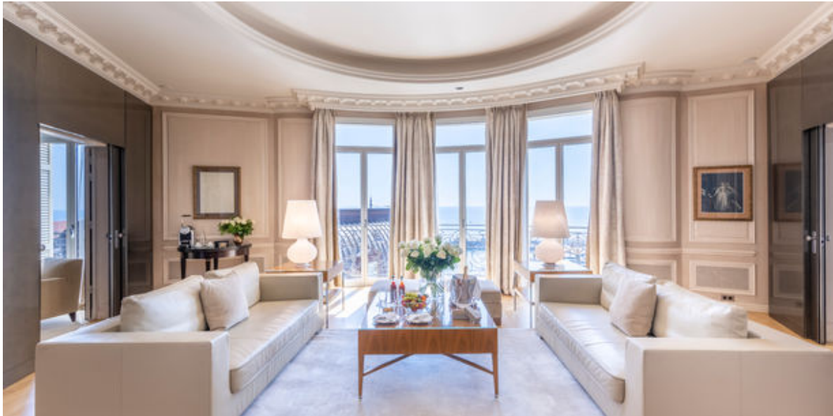
Diamond Suite Principesca

Tra le sue proposte, la Diamond Suite Principesca è una delle più spaziose dello stabilimento. Quasi 300 m 2 di lusso e raffinatezza, arredati come se si trattasse un appartamento dotato di tre camere e un salone. Le tre terrazze offrono una vista panoramica sul Mediterraneo e tutta la magia degli yacht e delle imbarcazioni che attraccano al porto Hercule.