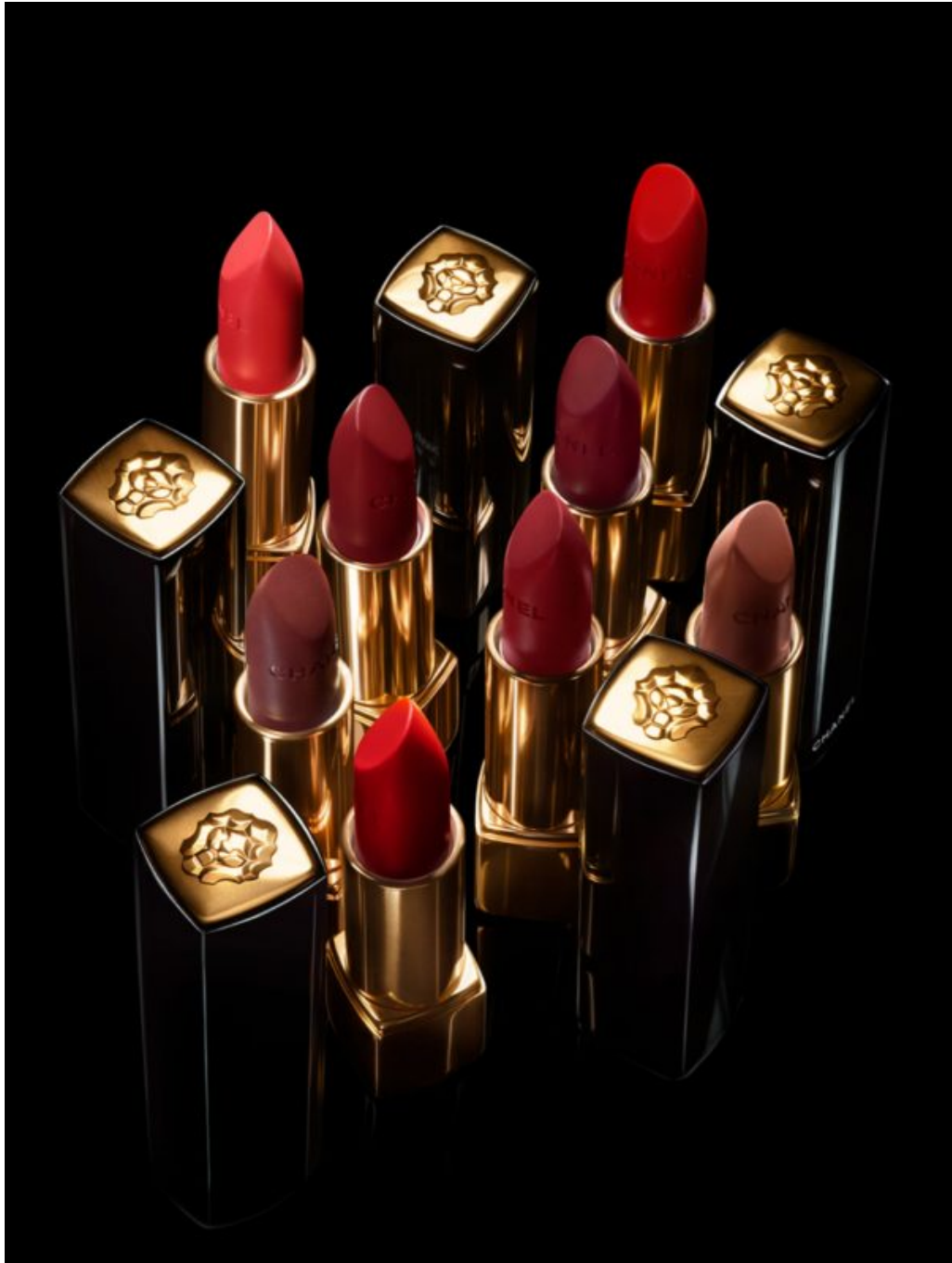
Rouge Allure Le Lion De Chanel