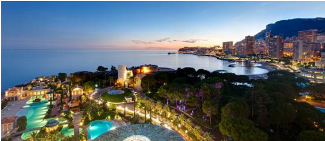
Monte-Carlo Bay Hotel & Resort

Il Monte- Carlo Bay Hotel & Resort, una penisola sul mediterraneo per i tifosi di tennis..